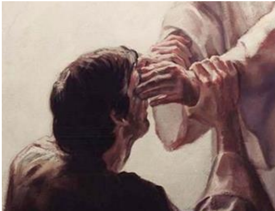
Johannes 9: 'Blind vertrouwen'