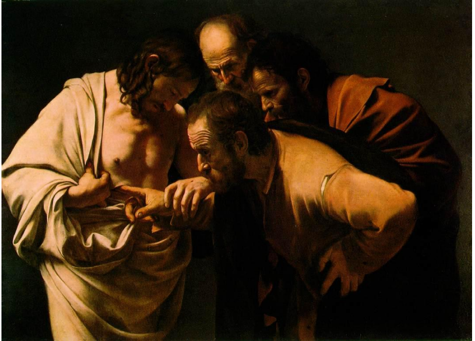
'De ongelovige Thomas'; Olieverf op doek, Caravaggio (1573 – 1610)